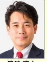
滝波 宏文 参議院議員(福井県)