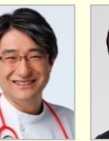
石田 昌宏 参議院議員