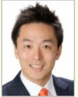
村井 英樹 衆議院議員(埼玉県)