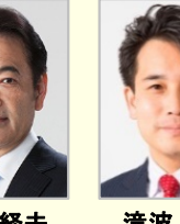
北村 経夫 参議院議員