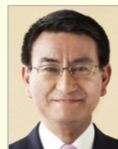
河野 太郎 衆議院議員（神奈川県）