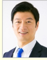
阿達 雅志 参議院議員