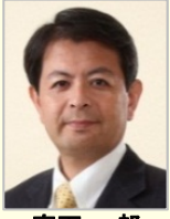
宮下 一郎 衆議院議員(長野県)