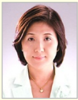
稲田 朋美 衆議院議員(福井県) 防衛大臣