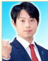
石崎 徹 衆議院議員(新潟県)