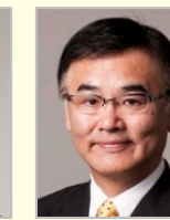
宮本 周司 参議院議員(石川県)