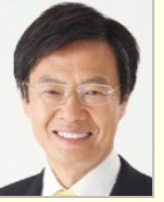
大見 正 衆議院議員(愛知県)