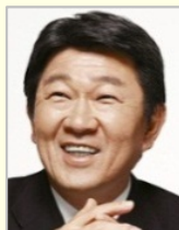
茂木 敏充 衆議院議員（栃木県） 自由民主党 政務調査会長