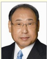
豊田 俊郎 参議院議員(千葉県) 内閣府大臣政務官