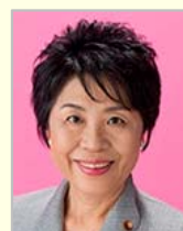
上川 陽子 衆議院議員（静岡県）