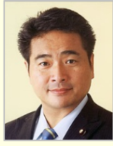
松下 新平 参議院議員(宮崎県)