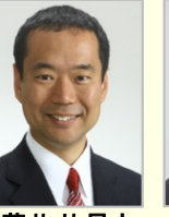
藤井 比早之 衆議院議員(兵庫県) 国土交通大臣政務官