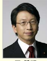
平 将明 衆議院議員(東京都)