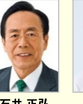
石井 正弘 参議院議員(岡山県)