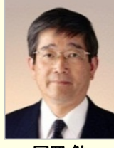
富岡 勉 衆議院議員(長崎県)