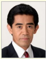
逢沢 一郎 衆議院議員(岡山県)