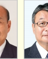
二之湯 智 参議院議員(京都府)