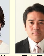
佐藤 ゆかり 衆議院議員(大阪府)