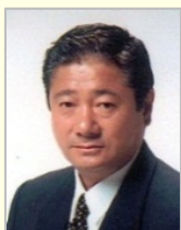
今津 寛 衆議院議員（北海道）