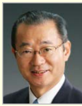
河村 建夫 衆議院議員(山口県)