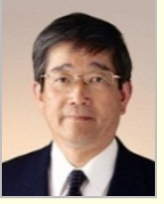
富岡 勉 衆議院議員(長崎県)