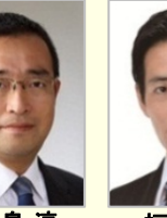
津島 淳 衆議院議員(青森県)