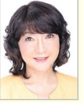
片山 さつき 参議院議員