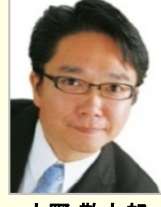
大野 敬太郎 衆議院議員(香川県)