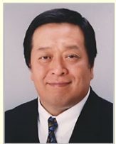
浜田 靖一 衆議院議員(千葉県)