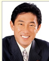
岸田 文雄 衆議院議員(広島県) 自由民主党 政務調査会長