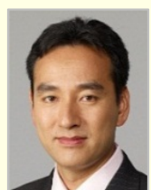
山際 大志郎 衆議院議員（神奈川県）