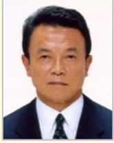
麻生 太郎 衆議院議員(福岡県) 副総理 財務・金融大臣