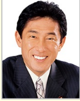
岸田 文雄 衆議院議員(広島県) 外務大臣