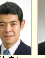
辻 清人 衆議院議員(東京都)