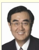
原田 憲治 衆議院議員（大阪府） 総務副大臣