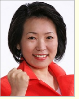
阿部 俊子 衆議院議員(岡山県)