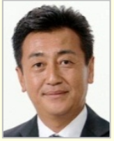
星野 剛士 衆議院議員(神奈川県)