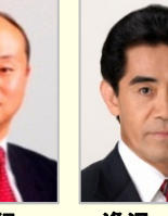
宮澤 博行 衆議院議員(静岡県) 防衛大臣政務官 内閣府大臣政務官