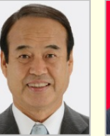
神谷 昇 衆議院議員(大阪府)