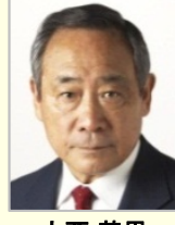
大西 英男 衆議院議員(東京都)