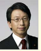
平 将明 衆議院議員(東京都)