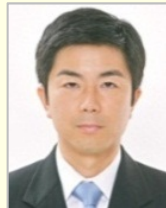
牧原 秀樹 衆議院議員(埼玉県) 厚生労働副大臣