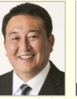
井上 貴博 衆議院議員(福岡県)