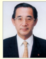
原田 義昭 衆議院議員(福岡県)