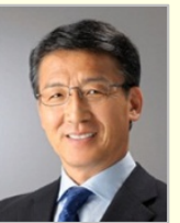
三原 朝彦 衆議院議員(福岡県)