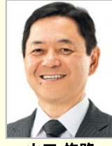
山田 修路 参議院議員(石川県)