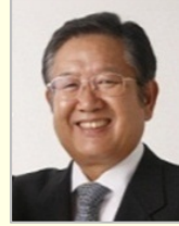
左藤 章 衆議院議員(大阪府)