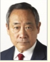
大西 英男 衆議院議員(東京都)