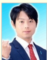
石崎 徹 衆議院議員（新潟県）