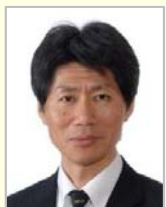
磯崎 仁彦 参議院議員(香川県)