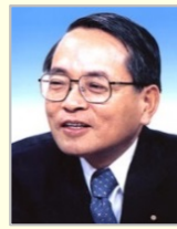
平沢 勝栄 衆議院議員(東京都)