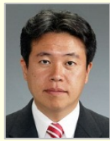
鶴保 庸介 参議院議員(和歌山県) 内閣府特命担当大臣 クールジャパン戦略担当大臣