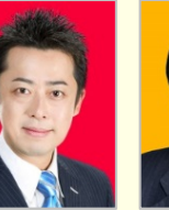
谷川 とむ 衆議院議員(大阪府)