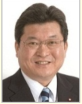
萩生田 光一 衆議院議員(東京都) 内閣官房副長官