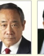
大西 英男 衆議院議員(東京都)