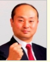
宮澤 博行 衆議院議員(静岡県)