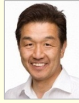
赤池 誠章 参議院議員(山梨県)