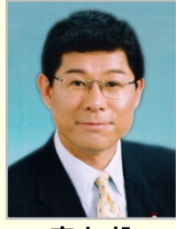
高木 毅 衆議院議員(福井県)