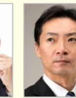
三宅 伸吾 参議院議員(香川県)