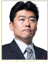
鬼木 誠 衆議院議員(福岡県)