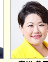
宮内 秀樹 衆議院議員(福岡県)