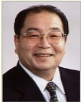
北村 誠吾 衆議院議員(長崎県)