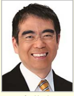
安藤 裕 衆議院議員(京都府)