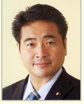
松下 新平 参議院議員(宮崎県)