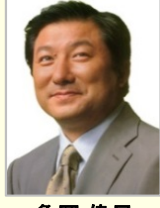
亀岡 偉民 衆議院議員(福島県)