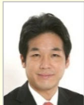
藺浦 健太郎 衆議院議員(千葉県) 内閣総理大臣補佐官