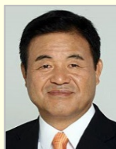
遠藤 利明 衆議院議員（山形県）