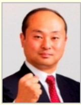
宮澤 博行 衆議院議員(静岡県) 防衛大臣政務官 内閣府大臣政務官