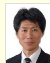
磯崎 仁彦 参議院議員（香川県）