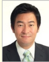
秋元 司 衆議院議員(東京都)