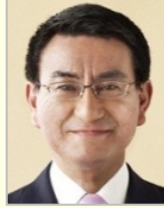
河野 太郎 衆議院議員(神奈川県)