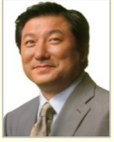
亀岡 偉民 衆議院議員(福島県)