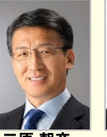
三原 朝彦 衆議院議員(福岡県)