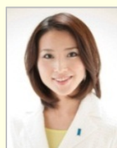
金子 恵美 衆議院議員（新潟県） 総務大臣政務官