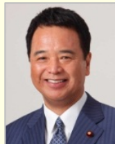
甘利 明 衆議院議員(神奈川県)