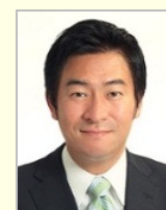
秋元 司 衆議院議員（東京都）