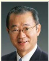
河村 建夫 衆議院議員(山口県)