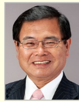
竹本 直一 衆議院議員(大阪府)