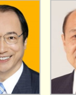
中川 雅治 参議院議員(東京都)