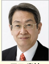
石田 真敏 衆議院議員(和歌山県)