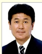
木村 太郎 衆議院議員（青森県）