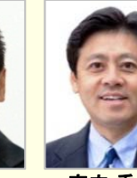
星野 剛士 衆議院議員(神奈川県)