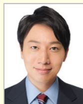
小倉 将信 衆議院議員(東京都) 総務大臣政務官