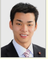
井野 俊郎 衆議院議員(群馬県)