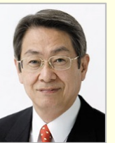
石田 真敏 衆議院議員(和歌山県)