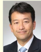
笹川 博義 衆議院議員(群馬県) 環境大臣政務官