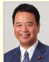
甘利 明 衆議院議員（神奈川県）