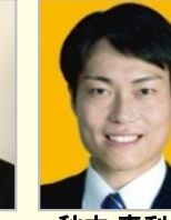
青山 周平 衆議院議員(愛知県)