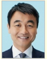
佐々木 紀 衆議院議員(石川県)