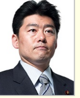
鬼木 誠 衆議院議員(福岡県)