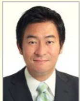
秋元 司 衆議院議員(東京都) 国土交通副大臣 兼 内閣府副大臣 兼 復興副大臣