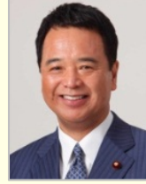
甘利 明 衆議院議員(神奈川県)