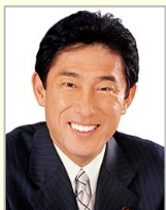
岸田 文雄 衆議院議員（広島県） 外務大臣