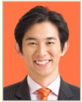
小林 鷹之 衆議院議員(千葉県)