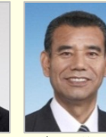
勝俣 孝明 衆議院議員(静岡県)