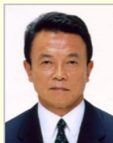
麻生 太郎 衆議院議員（福岡県） 副総理 財務・金融大臣