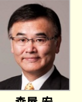
宮本 周司 参議院議員(石川県)