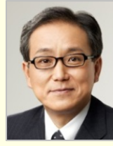
江島 潔 参議院議員(山口県)