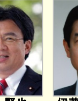
秋葉 賢也 衆議院議員(宮城県)