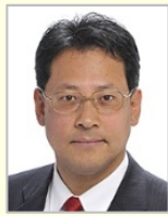
関 芳弘 衆議院議員(兵庫県) 環境副大臣