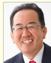
西銘 恒三郎 衆議院議員(沖縄県) 経済産業副大臣