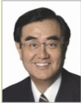
原田 憲治 衆議院議員(大阪府) 総務副大臣