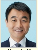
佐々木 紀 衆議院議員(石川県)