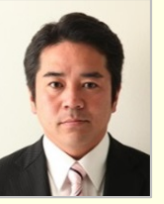
青山 周平 衆議院議員(愛知県)