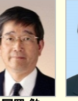
富岡 勉 衆議院議員(長崎県)