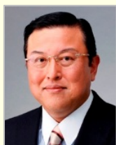
長坂 康正 衆議院議員(愛知県) 復興大臣政務官 内閣府大臣政務官