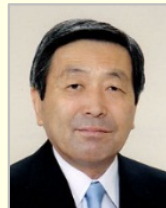
林 幹雄 衆議院議員(千葉県)