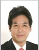
藺浦 健太郎 衆議院議員(千葉県) 外務副大臣