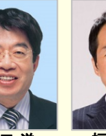
平口 洋 衆議院議員(広島県)