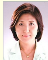
稲田 朋美 衆議院議員(福井県) 防衛大臣