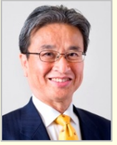
北川 知克 衆議院議員(大阪府)