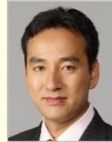
山際 大志郎 衆議院議員(神奈川県)