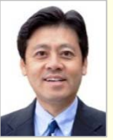
宮内 秀樹 衆議院議員(福岡県)