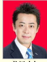
谷川 とむ 衆議院議員(大阪府)