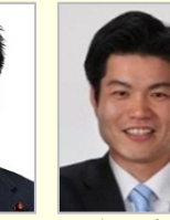
鬼木 誠 衆議院議員(福岡県)