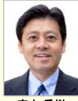
宮内 秀樹 衆議院議員(福岡県)