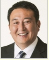
井上 貴博 衆議院議員(福岡県)