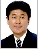
木村 太郎 衆議院議員(青森県)