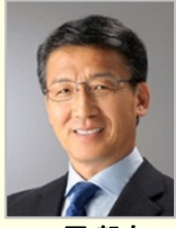
三原 朝彦 衆議院議員(福岡県)