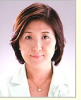
稲田 朋美 衆議院議員(福井県)