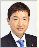
瀬戸 隆一 衆議院議員(香川県)