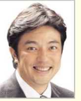
中山 泰秀 衆議院議員(大阪府)