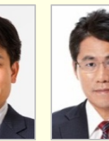
滝波 宏文 参議院議員(福井県)