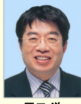
平口 洋 衆議院議員(広島県)