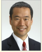
藤井 比早之 衆議院議員(兵庫県)