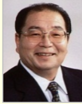
北村 誠吾 衆議院議員(長崎県)