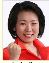
阿部 俊子 衆議院議員(岡山県)