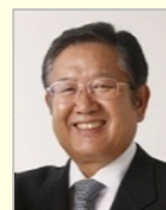
左藤 章 衆議院議員（大阪府）