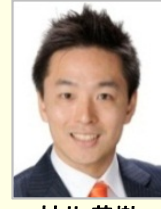
村井 英樹 衆議院議員(埼玉県)