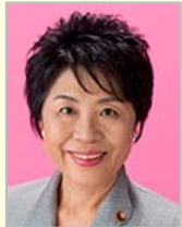
上川 陽子 衆議院議員(静岡県) 法務大臣