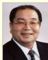
北村 誠吾 衆議院議員（長崎県）