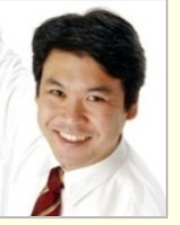
松本 洋平 衆議院議員(東京都)