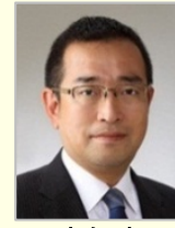
津島 淳 衆議院議員(青森県)