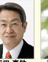
石田 真敏 衆議院議員(和歌山県)