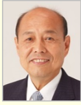
二之湯 智 参議院議員(京都府)