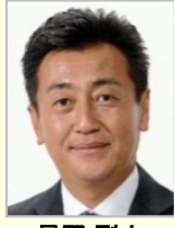
星野 剛士 衆議院議員(神奈川県)