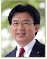
秋葉 賢也 衆議院議員(宮城県)