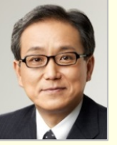
江島 潔 参議院議員(山口県)