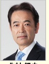
北村 経夫 参議院議員