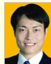
秋本 真利 衆議院議員(千葉県) 国土交通大臣政務官