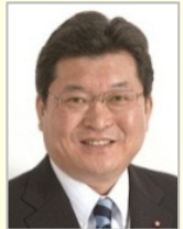
萩生田 光一 衆議院議員(東京都)