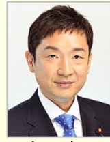
瀬戸 隆一 衆議院議員(香川県)