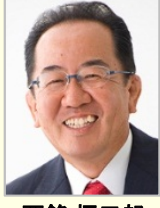
西銘 恒三郎 衆議院議員(沖縄県)