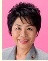
上川 陽子 衆議院議員(静岡県)