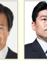
大見 正 衆議院議員(愛知県)