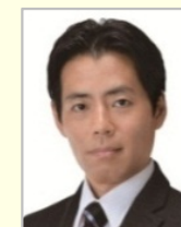
福田 達夫 衆議院議員(群馬県) 防衛大臣政務官 兼 内閣府大臣政務官