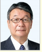
山本 順三 参議院議員(愛媛県)