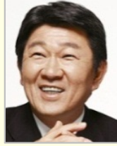
茂木 敏充 衆議院議員(栃木県) 自由民主党 政務調査会長