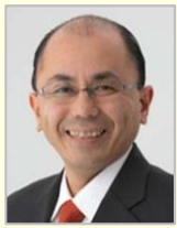
根本 幸典 衆議院議員(愛知県) 国土交通大臣政務官 内閣府大臣政務官