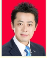
谷川 とむ 衆議院議員(大阪府)