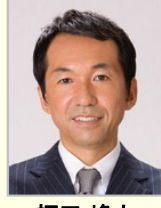
福田 峰之 衆議院議員(神奈川県)