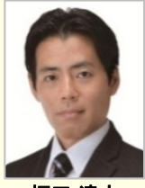
福田 達夫 衆議院議員(群馬県)