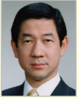
伊藤 信太郎 衆議院議員(宮城県)