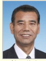
神山 佐市 衆議院議員(埼玉県)