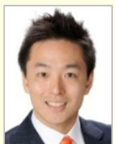
村井 英樹 衆議院議員(埼玉県) 内閣府大臣政務官