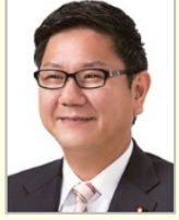
穴見 陽一 衆議院議員(大分県)