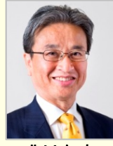
北川 知克 衆議院議員(大阪府)