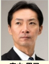
宮本周司 参議院議員(石川県)