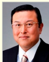
長坂 康正 衆議院議員(愛知県) 復興大臣政務官 内閣府大臣政務官