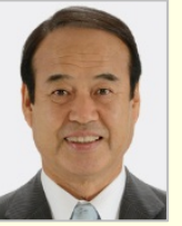
神谷 昇 衆議院議員(大阪府)