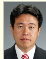
鶴保 庸介 参議院議員(和歌山県) 内閣府特命担当大臣 クールジャパン戦略担当大臣