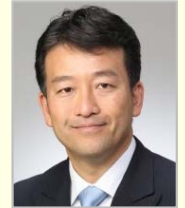
笹川 博義 衆議院議員(群馬県)