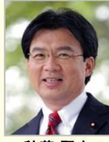
秋葉 賢也 衆議院議員(宮城県)