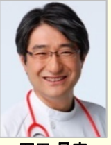
石田 昌宏 参議院議員