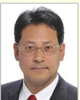
関 芳弘 衆議院議員(兵庫県) 環境副大臣