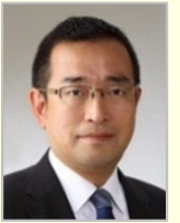
津島 淳 衆議院議員(青森県)