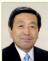
林 幹雄 衆議院議員（千葉県）