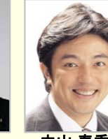
平 将明 衆議院議員(東京都)