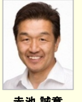
赤池 誠章 参議院議員(山梨県)