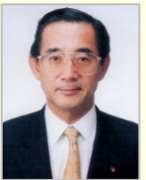
原田 義昭 衆議院議員(福岡県)