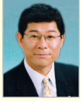
高木 毅 衆議院議員(福井県)