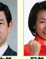
伊藤 信太郎 衆議院議員(宮城県)