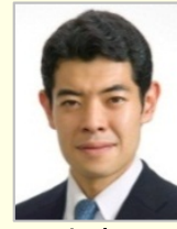
辻 清人 衆議院議員(東京都)