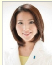
金子 恵美 衆議院議員(新潟県) 総務大臣政務官