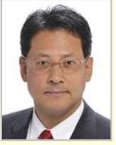
関 芳弘 衆議院議員(兵庫県)