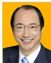
中川 雅治 参議院議員(東京都) 環境大臣