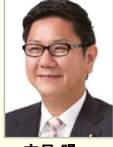
穴見 陽一 衆議院議員(大分県)