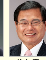
河村 建夫 衆議院議員(山口県)