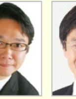
大野 敬太郎 衆議院議員(香川県)