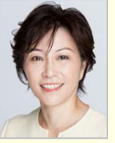
佐藤 ゆかり 衆議院議員(大阪府)