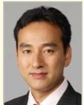
山際 大志郎 衆議院議員(神奈川県)