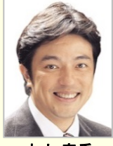
中山 泰秀 衆議院議員(大阪府)