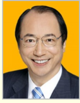
中川 雅治 参議院議員(東京都)