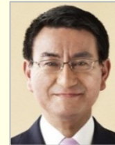
河野 太郎 衆議院議員(神奈川県) 外務大臣