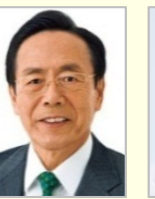
石井 正弘 参議院議員(岡山県)