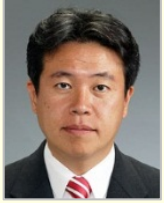
鶴保 庸介 参議院議員(和歌山県)