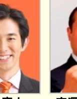
小林 鷹之 衆議院議員(千葉県) 防衛大臣政務官