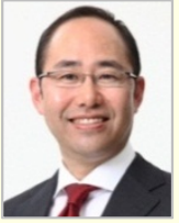
細田 健一 衆議院議員(新潟県)