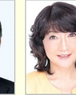
山本 順三 参議院議員(愛媛県)