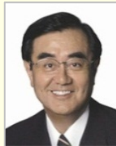
原田 憲治 衆議院議員(大阪府)