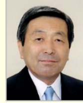
林 幹雄 衆議院議員(千葉県)