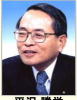
平沢 勝栄 衆議院議員(東京都)