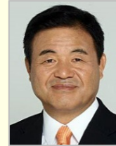
遠藤 利明 衆議院議員(山形県)