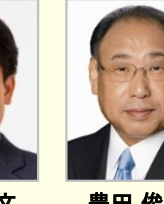
滝波 宏文 参議院議員(福井県)