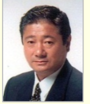
今津 寛 衆議院議員(北海道)