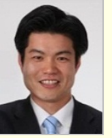
勝俣 孝明 衆議院議員(静岡県)