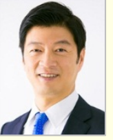
阿達 雅志 参議院議員