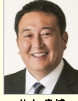
井上 貴博 衆議院議員(福岡県)