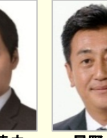
福田 達夫 衆議院議員(群馬県)