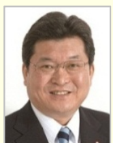
萩生田 光一 衆議院議員（東京都） 内閣官房副長官