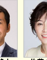
福田 峰之 衆議院議員(神奈川県)