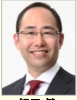
細田 健一 衆議院議員(新潟県) 農林水産大臣政務官