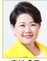
宮川 典子 衆議院議員(山梨県)