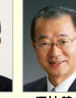
逢沢 一郎 衆議院議員(岡山県)