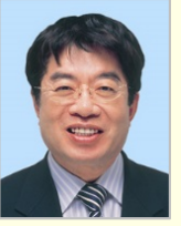
平口 洋 衆議院議員(広島県)