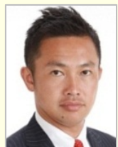
中谷 真一 衆議院議員(山梨県)