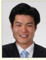
勝俣 孝明 衆議院議員(静岡県)