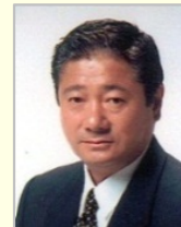
今津 寛 衆議院議員(北海道)