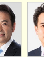
北村 経夫 参議院議員