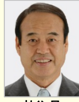
神谷 昇 衆議院議員(大阪府)