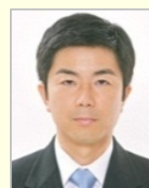
牧原 秀樹 衆議院議員（埼玉県）