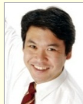
松本 洋平 衆議院議員(東京都) 内閣府副大臣