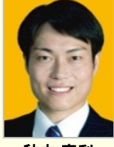
秋本 真利 衆議院議員(千葉県)