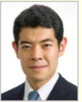
辻 清人 衆議院議員(東京都)