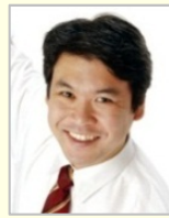
松本 洋平 衆議院議員(東京都) 内閣府副大臣