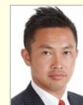
中谷 真一 衆議院議員（山梨県）