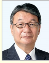
山本 順三 参議院議員(愛媛県)