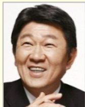
茂木 敏充 衆議院議員(栃木県) 経済再生担当大臣