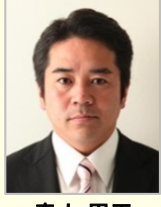
青山 周平 衆議院議員(愛知県)