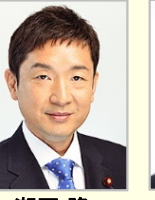
瀬戸 隆一 衆議院議員(香川県)