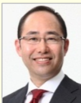
細田 健一 衆議院議員(新潟県) 農林水産大臣政務官