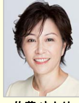
佐藤 ゆかり 衆議院議員(大阪府)