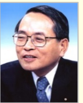
平沢 勝栄 衆議院議員(東京都)