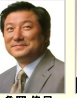
亀岡 偉民 衆議院議員(福島県)