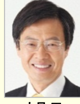
大見 正 衆議院議員(愛知県)