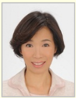
堀内 詔子 衆議院議員(山梨県) 厚生労働大臣政務官