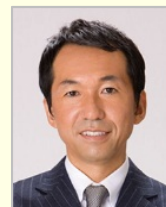
福田 峰之 衆議院議員(神奈川県) 内閣府副大臣