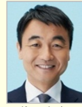
佐々木 紀 衆議院議員(石川県)