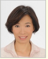
堀内 韶子 衆議院議員(山梨県)