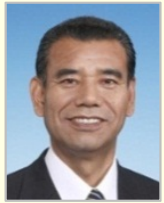
神山 佐市 衆議院議員(埼玉県)