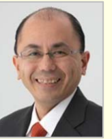
根本 幸典 衆議院議員(愛知県)