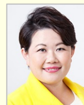
宮川 典子 衆議院議員(山梨県) 文部科学大臣政務官