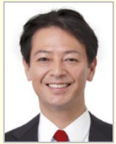
工藤 彰三 衆議院議員(愛知県)