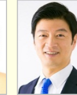
片山 さつき 参議院議員