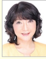
片山 さつき 参議院議員