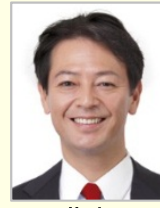
工藤 彰三 衆議院議員(愛知県)