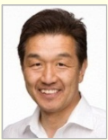
赤池 誠章 参議院議員(山梨県)