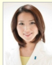
金子 恵美 衆議院議員(新潟県)