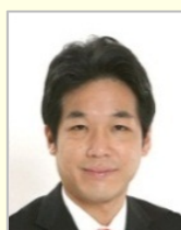
藺浦 健太郎 衆議院議員（千葉県） 外務副大臣