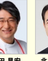
石田 昌宏 参議院議員