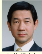
伊藤 信太郎 衆議院議員(宮城県)